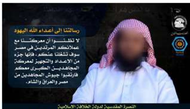
בתמונה מסר מאיים מפני בכיר בארגון אנצאר בית אל-

לעומת התגובות הרפות של פעילי הגיהאד האסלאמי, בלטה השתתפות ערה של כל הארגונים הסלפים הגיהאדים