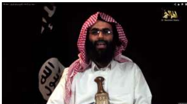
קטע מנאומו של השיח' אברהים אל-רביש

פגיעה באחת מרגלי הכיסא תוביל לקריסת הכיסא, קרי פגיעה באחד ממשטרי ערב המשתפים פעולה עם ישראל תוביל לפגיעה קשה בביטחונה של ישראל. 13