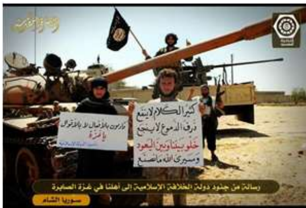
פעילי דעאש בסוריה מנופפים בכרזות תמיכה בתושבי עזה