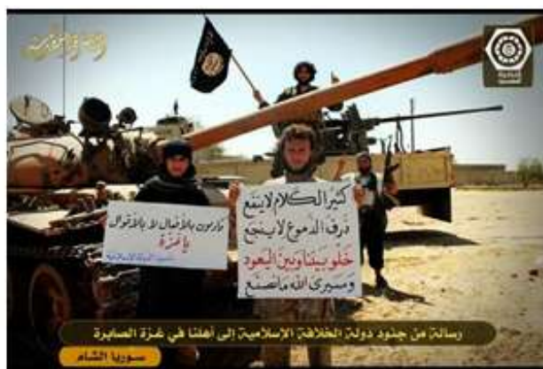
פעילי דעאש בסוריה מנופפים בכרזות תמיכה בתושבי עזה

באזורי קונפליקט דוגמת בורמה ווזיריסטאן. 3 אבו חארת' אל-מקדסי, חבר ארגון סלפי ג'יהאדי בסוריה בשם "צבא אנצאר אל-שריעה" הסתפק בקלטת ווידאו התומכת בתושבי עזה. 4 כמה פעילי IS הסתפקו בהנפת כרוזים להבעת תמיכה עם תושבי עזה. 5 בכתב העת Dabiq שיצא בסוף יולי השנה באנגלית מטעם IS, הקדיש העורך פסקה אחת למלחמה בעזה והדגיש כי דרכו של הארגון אינה מילים אלא במעשים: "Its actions speak louder than its words" and it is only a matter of time and patience before it reaches Palestine to fight the barbaric Jews and "kill those of them hiding behind the gharqad trees - the trees of the Jews". בנוסף הדגיש הארגון כי יילחם בכל מה שיעמוד בפני פלסטיין. 6