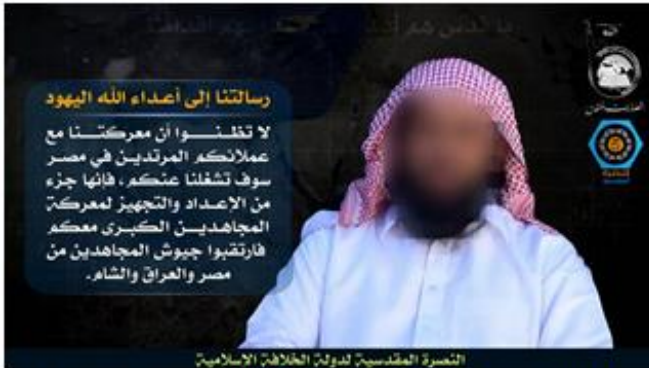
בתמונה מסר מאיים מפי בכיר בארגון אנצאר בית אל-מקדם לפגוע ביהודים

לעומת התגובות הרפות של פעילי הג'יהאד האסלאמי, בלטה השתתפות ערה של כל הארגונים