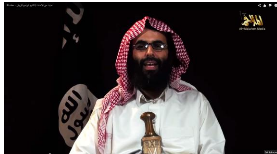
קטע מנאומו של השיח' אברההים אל-רביש

השיח' אברההים רביש, אידיאולוג בכיר בארגון אל-קאעדה בחצי האי ערב, ניצל את הלחימה בעזה כדי לנגח את המשטר המצרי והסעודי. בקלטת ווידאו שהתפרסמה ב-12 באוגוסט על ידי מוסד התקשורת אל-מלאחס, הדגיש אל-רביש כי שליטי ערב הסעודית שכרו את אל-סיסי כדי להדק את המצור על רצועת עזה ולסגור את הגבול עם עזה במהלך המבצע נגד חמאס. לראייתו, ישראל משולה לכיסא הנשען על רגליים המשולות לשליטי ערב "הבוגדים". פגיעה באחת מרגלי הכיסא תוביל לקריסת הכיסא, קרי פגיעה באחד ממשטרי ערב המשתפים פעולה עם ישראל תוביל לפגיעה קשה בביטחונה של ישראל. 13