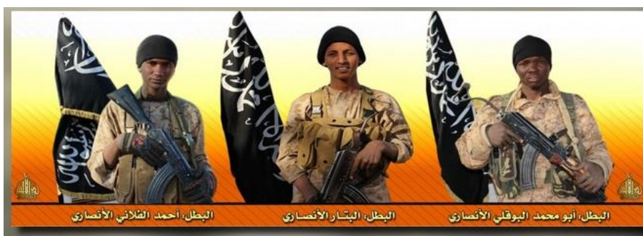
שלושה ממבצעי פיגוע הטרור בבורקינה פאסו

אזרחים זרים. לדברי הארגון, הפיגוע כוון נגד "הצלבנים הגוזלים את אוצרותינו ומשאבי הטבע שלנו ואשר פוגעים במקומות הקדושים שלנו", והוסיף כי לפיגוע קדמה תכנית מדוקדקת וקפדנית ואיסוף מודיעיני בשטח. לדבריו, יעד הפיגוע נחשב ל"אחת המאורות המסוכנות ביותר של הריגול הבינלאומי במערב יבשת אפריקה, בייחוד מלון ספלנדיד.. ממנו ניהלו מלחמה נגד האסלאם ובו נערכו עסקאות לגזלת משאבי אדמות המוסלמים". הודגש כי הפיגוע הינו חוליה בשרשרת פיגועים שנועדה לטהר את אדמות המוסלמים מריכוזי מרגלים, לנקום על טבח תושביה המוסלמים של אפריקה התיכונה, מאלי וארצות אחרות באפריקה ולנקום על ביזוי כבודו של הנביא מחמד. הארגון הוסיף כי הפיגוע נועד להוות תזכורת לצרפת ובעלות בריתה שהביטחון הינו דבר ארעי וכי אזרחי צרפת לא ייהנו מביטחון. ההודעה נחתמה בפנייה לאזרחי צרפת להתעשת אל מול מדיניות הדיכוי של ממשלת צרפת נגד המוסלמים (ראו באנר מעלה). 4