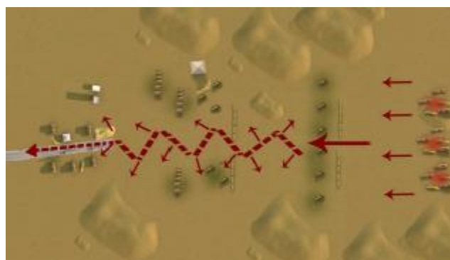
התפרסות בצורת "מניפה"