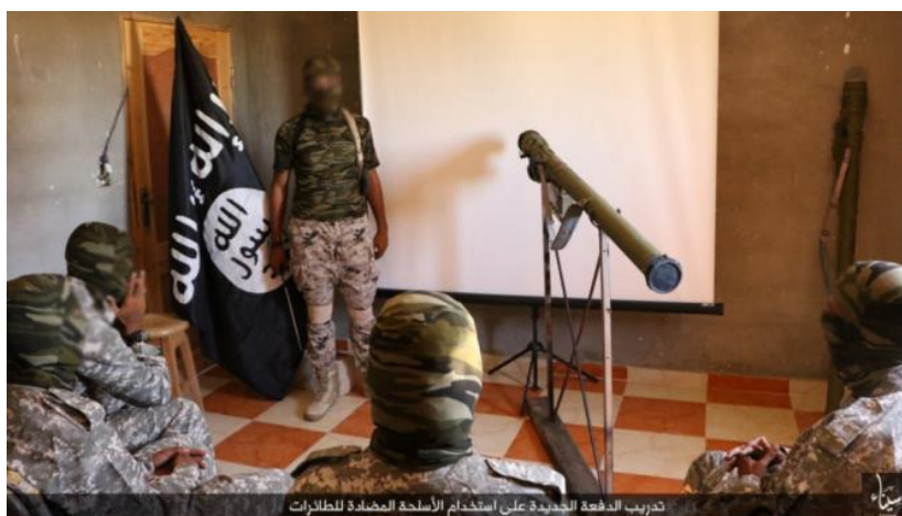
הדרכה בנושא IGLA על ידי דאעש סיני