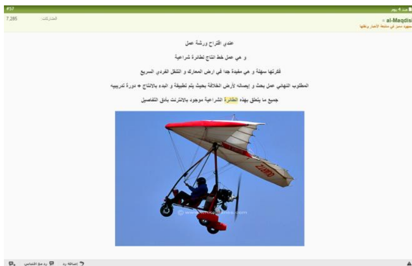
הצעה לשלב דאונים במסגרת פעילותה של "המדינה האסלאמית"

בפוסט אחר, הציע אותו גולש להקים פס ייצור לדאונים לאחר איסוף מידע מהאינטרנט, עריכת קורס הכשרה בנושא והעברת המידע ל"מדינה האסלאמית".