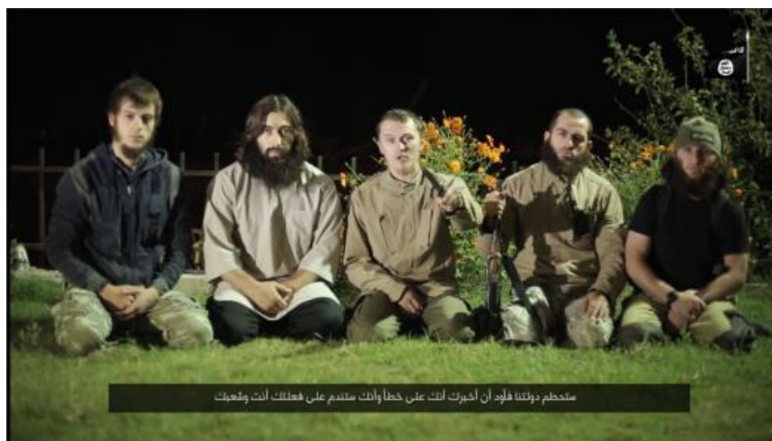
שיגור איומים כלפי פוטין ורוסיה ממחוז נינווה בעיראק

המתקנים לרגל הפלת המטוס הופיעו בסוף הסרטון חמישה פעילים, כשאחד מהם שיגר איומים ברוסית כלפי רוסיה ופוטין, תוך איום לבצע פיגועים על אדמת רוסיה עצמה. 4